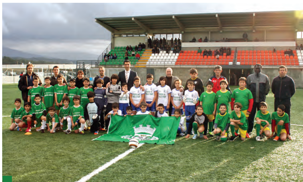
Torneio Inter-freguesias sub-11 decorreu no Estádio Municipal Rui Manuel Lima