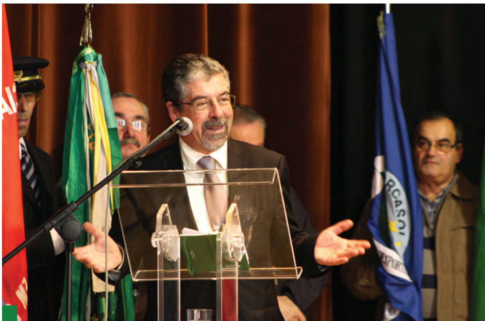
Presidente da ANMP, Manuel Machado, afirmou que o Estado Social está a ser atacado

Num discurso curto, mas incisivo, lembrou que, nos últimos 40 anos, desde o 25 de Abril, o trabalho mais importante que se fez em Portugal foi o Estado Social - “que está a ser atacado” - e foi, também, o trabalho feito pelas autarquias portuguesas. “Quando se avança para liquidar os poderes locais, de proximidade, as pessoas ficam mais distantes e os problemas são mais difíceis de resolver”, notou, assumindo por isso