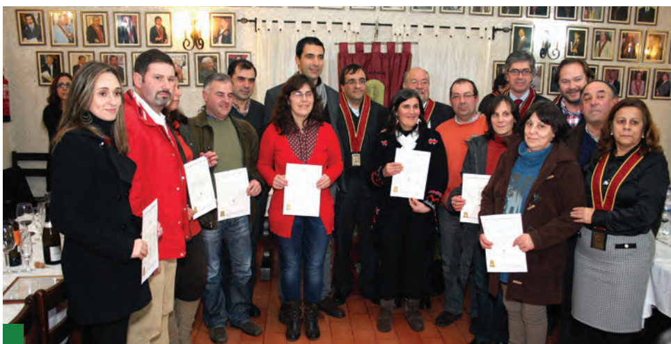
Comerciantes aderiram à Semana da Chanfana, decorando as suas montras

à iniciativa, o que, para o Presidente da Câmara, «demonstra a envolvimento que se tem criado em torno desta iniciativa, criando dinâmicas e sinergias extremamente positivas, que produzem importantes retornos também para o tecido comercial do concelho».