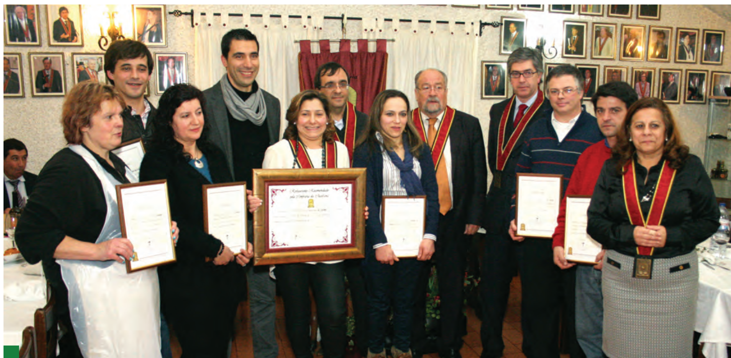
Restaurante “A Grelha” recebeu o Painel de Restaurante Recomendado pela Confraria da Chanfana

Municipal, «o balanço desta iniciativa é bastante positivo porque afirma cada vez mais a chanfana como uma marca, não só de Poiares, mas de toda a região, contruindo para uma maior afirmação de Poiares no contexto regional e nacional»