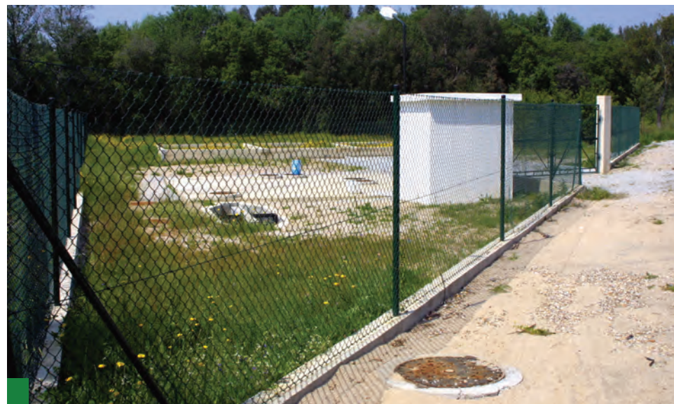
Tratamento de Esgotos da ETAR de Vale de Vaide é verdadeiramente eficaz

4. É evidente que é absolutamente impossível impedir que, durante a