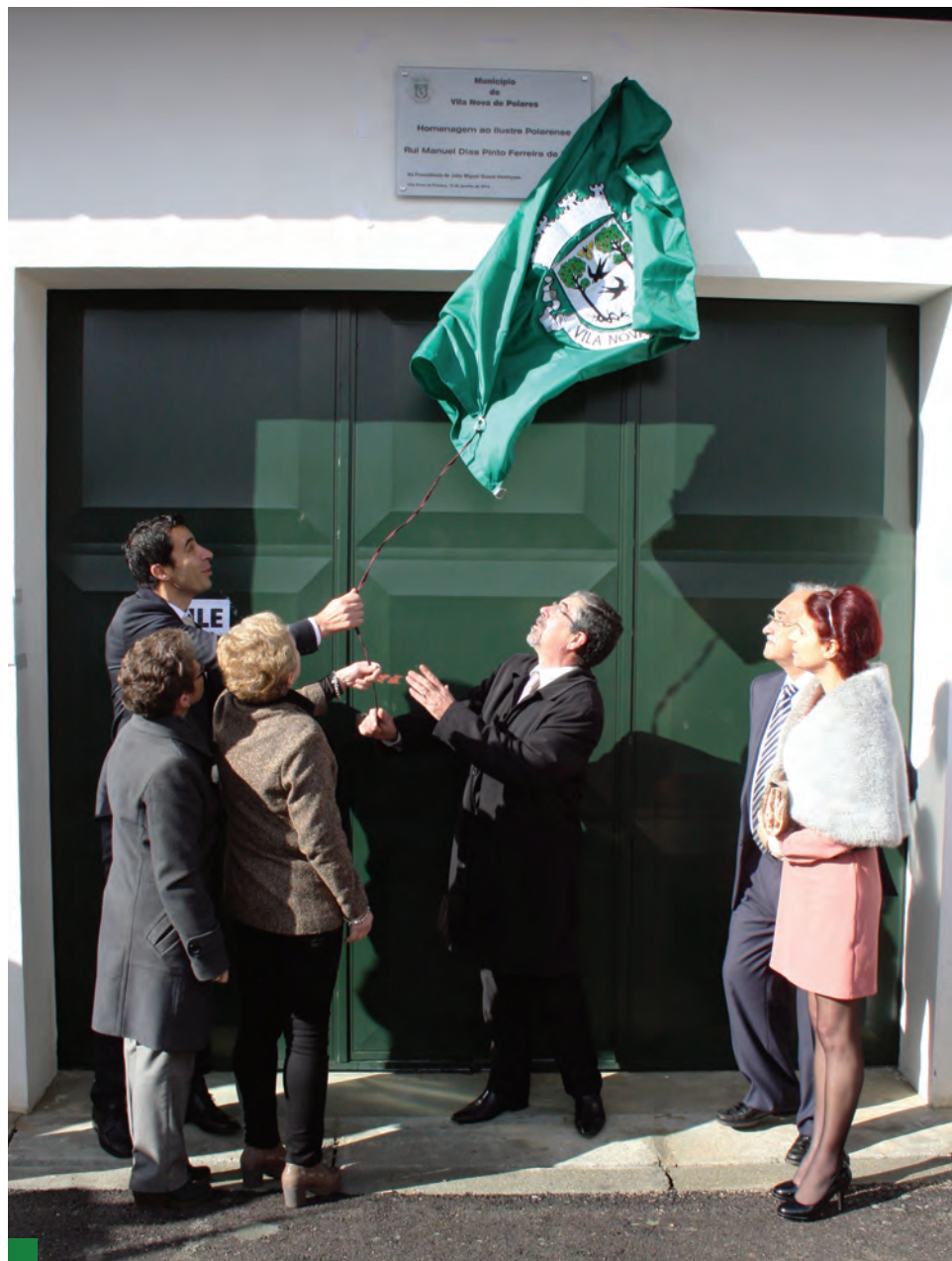
Momento em que foi descerrada a placa no Estádio Municipal Rui Manuel Lima, pela mão das filhas do homenageado, do Presidente da Câmara Municipal de Vila Nova de Poiares e do Presidente da ANMP, sob o olhar atento da Presidente da Assembleia Municipal e do Presidente da Associação de Futebol de Coimbra