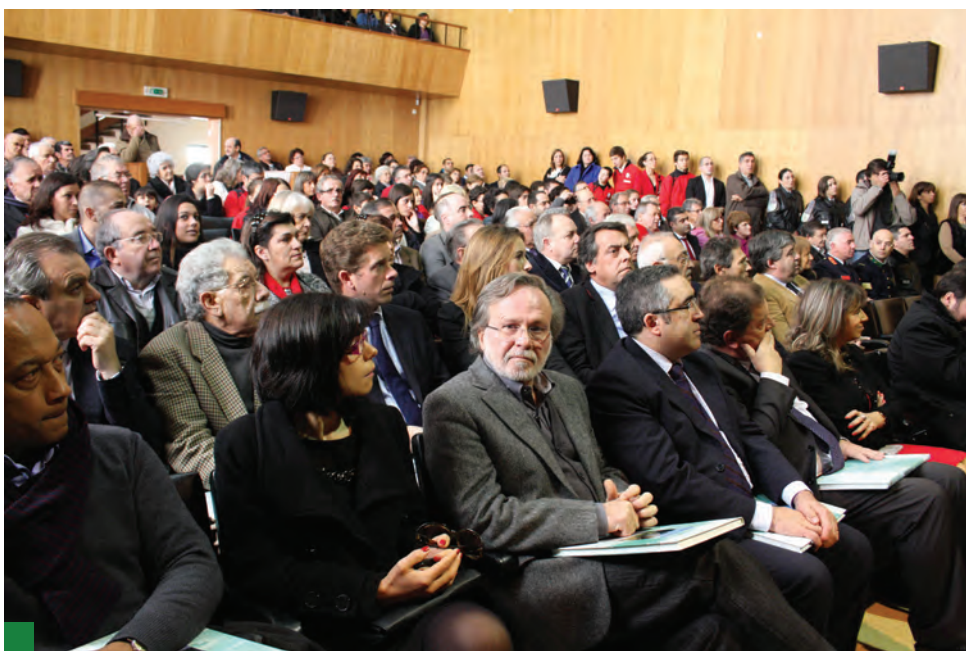
O Auditório do CCP encheu para celebrar o Feriado Municipal