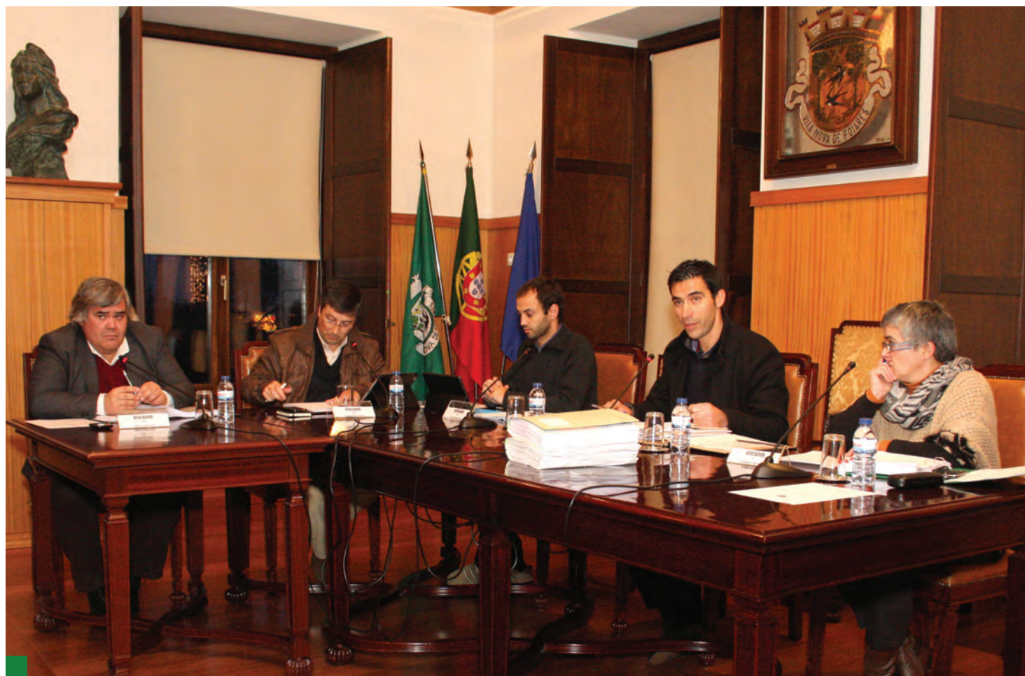
O Orçamento e Grandes Opções do Plano foi aprovado por maioria, com os votos contra dos vereadores da oposição

«Tentar menosprezar o valor da dívida, como se fosse algo que não tivesse importância, como tentaram fazer, é de uma irresponsabilidade sem dimensão», afirmou, referindo que face aos números reais, já apurados, de uma dívida de 21 milhões de euros, «e confrontados com a imposição da Lei das Finanças