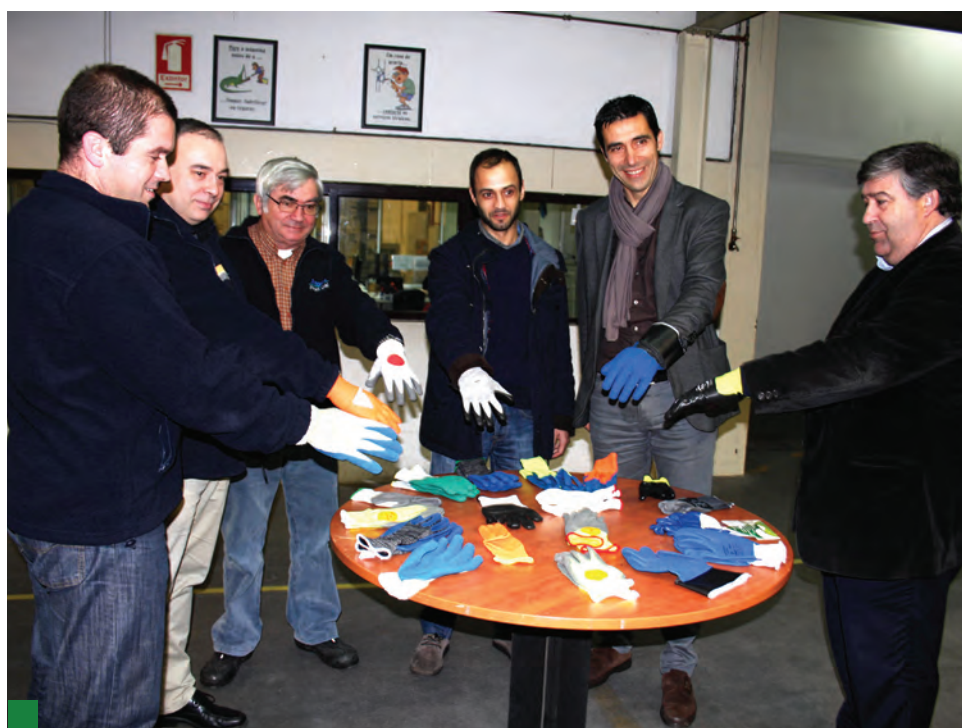
Presidente da Câmara ficou a conhecer os produtos desenvolvidos na Ansell - Portugal

Desta forma, considerou, «podem ganhar força associativa e capacidade de reivindicação, ajudando também o Município, na sua capacidade de intervenção e reivindicação junto das instâncias centrais, em especial no que respeita às acessibilidades». O Presidente referiu-se à necessidade de ganhar escala e força reivindicativa para 'lutar', não só por uma alternativa à Estrada da Beira, que colocasse Poiares em ligação com o nó da A13, em Ceira, mas também pela necessidade de uma boa ligação rodoviária ao IP3, que serviria não só o concelho de Vila Nova de Poiares, mas também os concelhos vizinhos e, com isso, alavancar o desenvolvimento económico de toda a região. Ideias que foram bem acolhidas pelos responsáveis