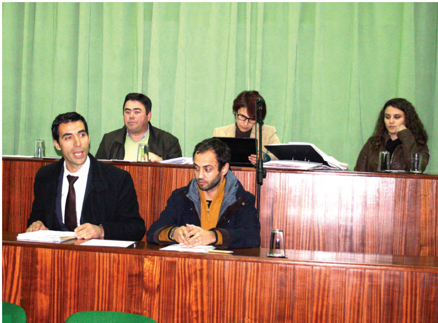
A situação financeira é uma das principais preocupações do Executivo Municipal

Apresentada situação financeira ao Sec. de Estado da Administração Local, António Leitão Amaro