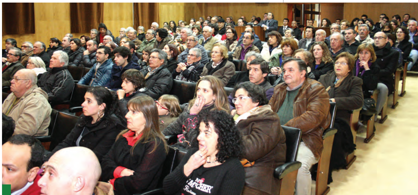
Durante a apresentação do balanço dos "100 dias de Mandato" (ver páginas 15 e 16)