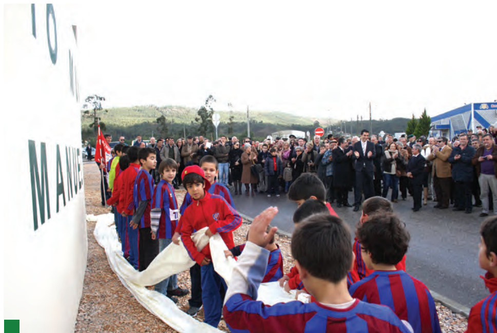
Camadas jovens da AD Poiares descerram o nome atribuído ao Estádio Municipal

As comemorações do 116º Aniversário da Restauração Definitiva do Concelho de Vila Nova de Poiares terminaram com a realização de um torneio inter-freguesias de futebol, sub-11, no novíssimo Estádio Municipal Rui Manuel Lima. A equipa vencedora foi a de Poiares-Sto. André, mas o ato competitivo ficou completamente relegado para segundo plano, num verdadeiro hino à prática desportiva, face à grande atitude de fair-play dos poiarenses mais pequeninos.