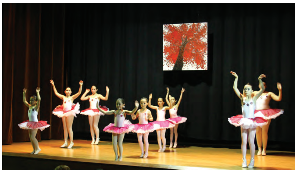
CCP acolheu o espectáculo "As Deusas da Dança" pelo Grupo de Ballet de Poiares

Além de evidenciar a polivalência e excelentes condições do Centro Cultural, este espectáculo veio ainda sublinhar que Poiares, também nesta matéria, tem 'cartas para dar' com muitos talentos de qualidade e grande nível artístico, à altura do melhor que existe e se faz na região e no país.