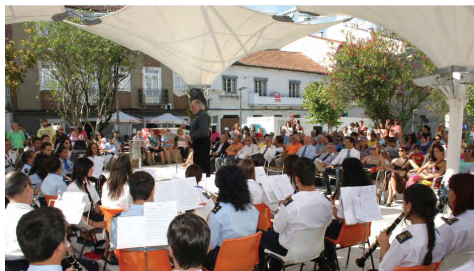
Ensemble de filarmónicas foi o ponto alto do evento