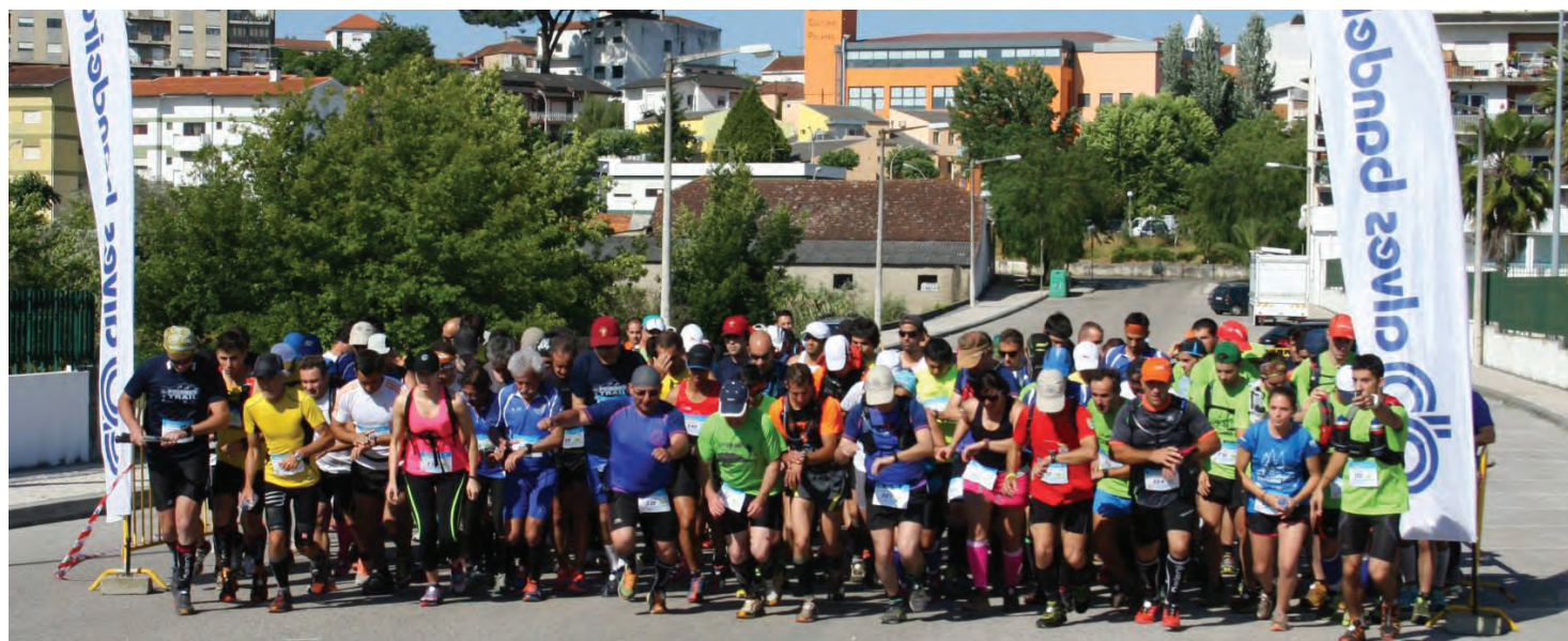
Partida para a prova de Trail ocorreu junto à Alameda Santo André, enquanto a Caminhada teve início no pavilhão da ARSM

O grande número de atletas, vindos dos mais diversos pontos do país, desde Chaves a Portalegre, para uma modalidade que ganha cada vez mais adeptos, demonstra claramente a intensa actividade da organização, a secção de Atletismo da ARSM, neste tipo de provas, num reconhecimento que há muito que ultrapassou as fronteiras do âmbito regional. No final da Prova o Município