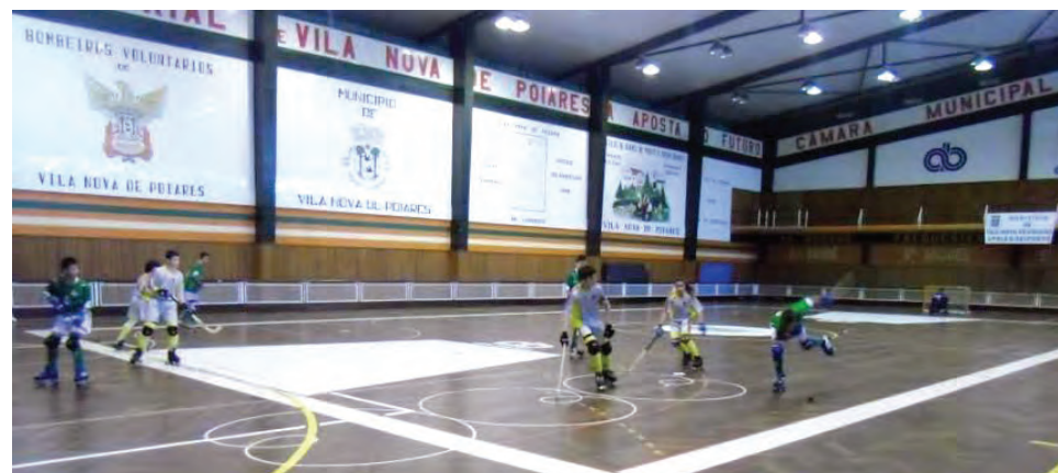
CCP acolheu o espectáculo "As Deusas da Dança" pelo Grupo de Ballet de Poiares

dá a conhecer os recursos naturais e endógenos do concelho, como a gastronomia, o que incentiva e dinamiza também a própria economia local.