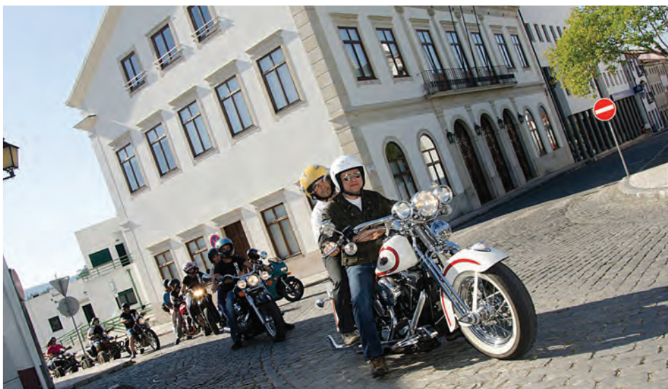
Utentes da APPACDM foram ‘motards’ por um dia