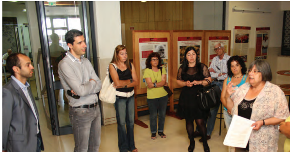
Exposição em parceria com a Delegação Regional do Partido Comunista Português