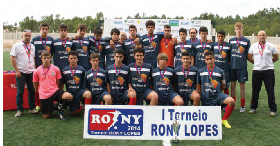
União Desportiva de Leiria