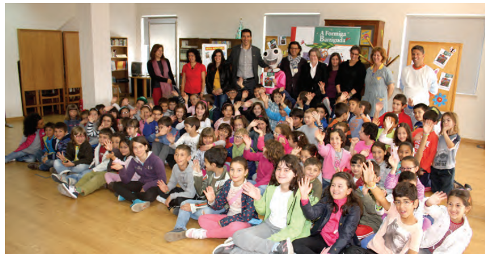
Uma das sessões que decorreu no Centro Cultural de Poiares

O Presidente da Câmara Municipal fez questão de estar presente nestes encontros, agradecendo a disponibilidade do autor para vir a Poiares apresentar a sua obra, para além de reforçar o objetivo destas iniciativas, nomeadamente, fomentar hábitos de leitura e proporcionar momentos culturais importantes para criar nas crianças um fator de motivação extra, permitindo que desenvolvam e cultivem o seu gosto pelos livros e pela leitura.