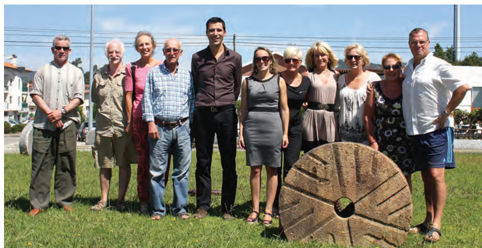
Alguns dos participantes reuniram no final do curso em almoço convívio

No final do curso, alguns das cerca de três dezenas de participantes decidiram reunir-se num almoço, para o qual convidaram o Presidente da Câmara.