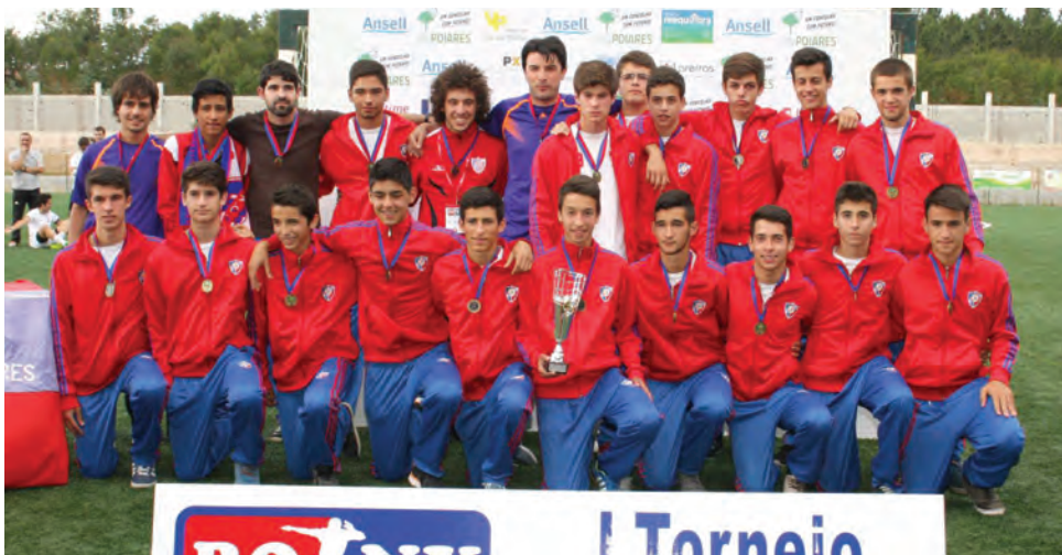
Associação Desportiva de Poiares

No final, veio ao de cima a ‘festa do futebol’ num verdadeiro hino aos valores da camaradagem, amizade e ‘fair-play’ que reinam nas camadas jovens.