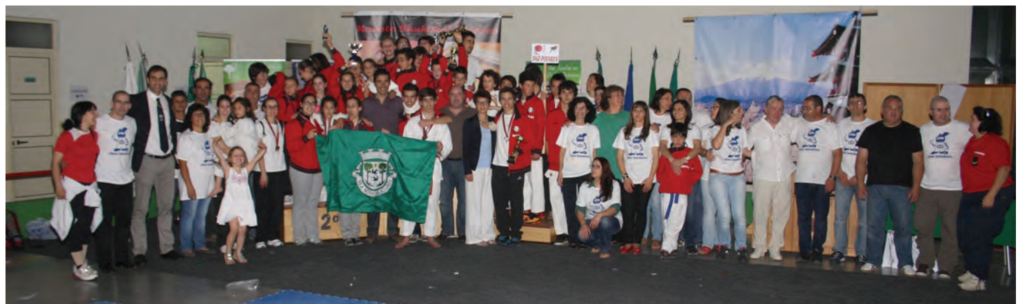
Foto de Grupo da Escola de Poiares, juntamente com o Presidente da Câmara e da Assembleia Municipal e demais entidades

Depois de ter recebido o Campeonato Nacional em 2013, uma fase de apuramento já este ano, e agora mais um Campeonato Nacional, Vila Nova de Poiares está a registar uma importante fase de crescimento da modalidade, com resultados extremamente positivos, que orgulham não só os participantes como o próprio Município, granjeando, desta forma importantes níveis de prestígio e reconhecimento.