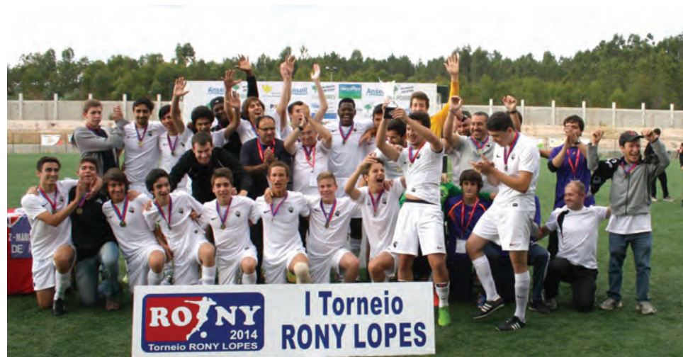
Associação Académica de Coimbra (Vencedor do Torneio)