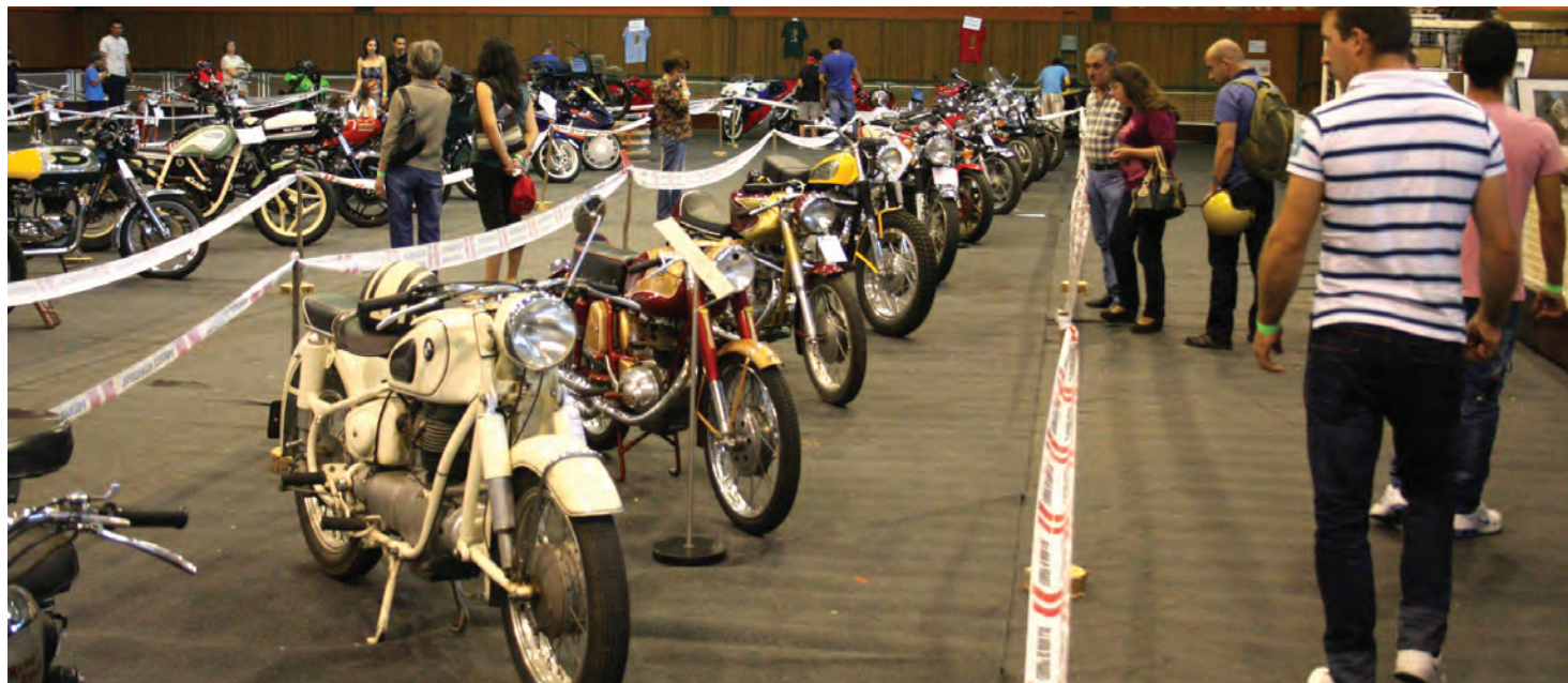
Foram vários os modelos e marcas de motos, algumas extremamente raras, que estiveram presentes no Pavilhão Gimnodesportivo

Os indicadores desta primeira edição não podiam ser melhores, deixando antever a realização de novas edições, seguramente com mais fatores de atratividade.