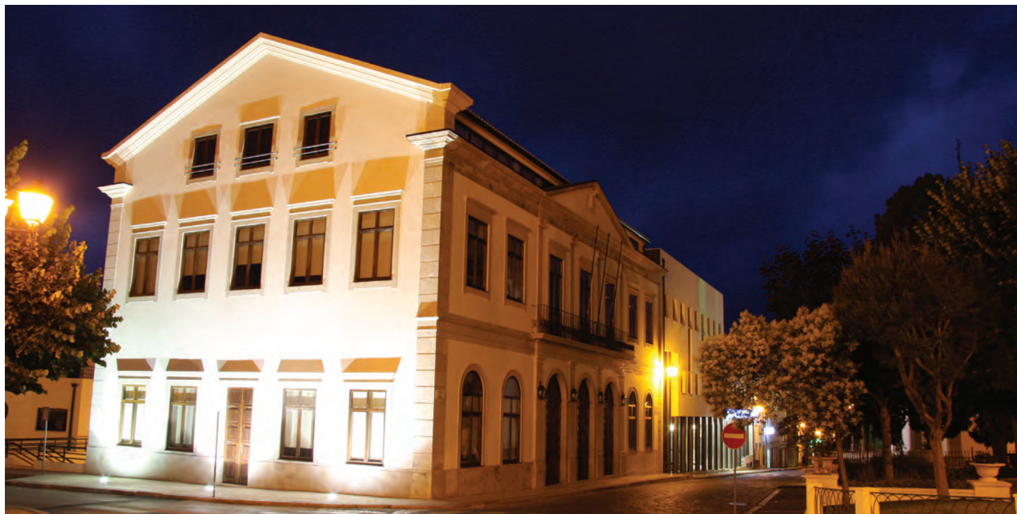
Relatório Final da Auditoria datado de Novembro de 2011, só chegou em Agosto de 2014 à Autarquia

Para melhor compreensão, o Presidente da Câmara leu alguns excertos das conclusões do Relatório que são verdadeiramente ‘arrasadoras’ para a gestão financeira do Município do anterior mandato, já que aponta “falta de fiabilidade da informação contabilística e insuficiências do sistema de controlo interno; ultrapassagem dos limites legais de endividamento e incumprimento da obrigação legal de redução do excesso de Endividamento Líquido; incumprimento dos objectivos previstos no Programa de Regularização Extraordinária de Dívidas