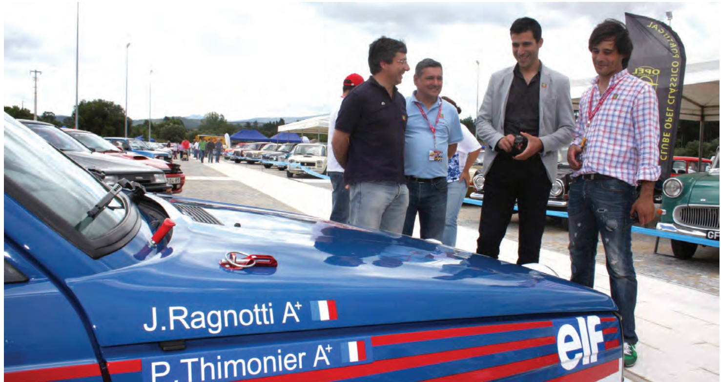
Antigo carro pilotado por Jean Ragnotti no Mundial de Ralis foi uma das várias “estrelas” presentes

O certame conseguiu reunir no mesmo espaço diversas atividades, desde exposição de clássicos, super-desportivos e acessórios auto, sendo que o ponto alto do evento aconteceu com o motorshow - uma demonstração automobilística em que marcaram presença automóveis que competiram em provas regionais, campeonatos nacionais e mundiais, com a proeza de ter conseguido ter ao volante de alguns deles campeões de diversas modalidades do desporto automóvel.