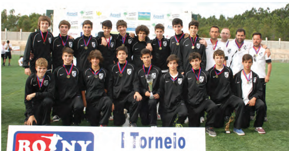
Sport Club Vitória de Guimarães