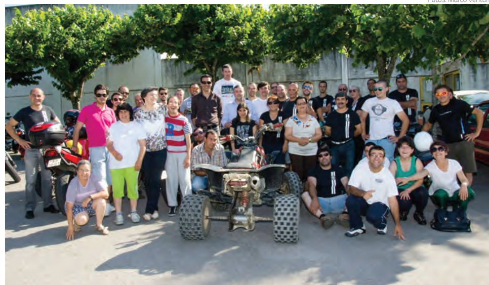
Organização entregou donativo à APPACDM