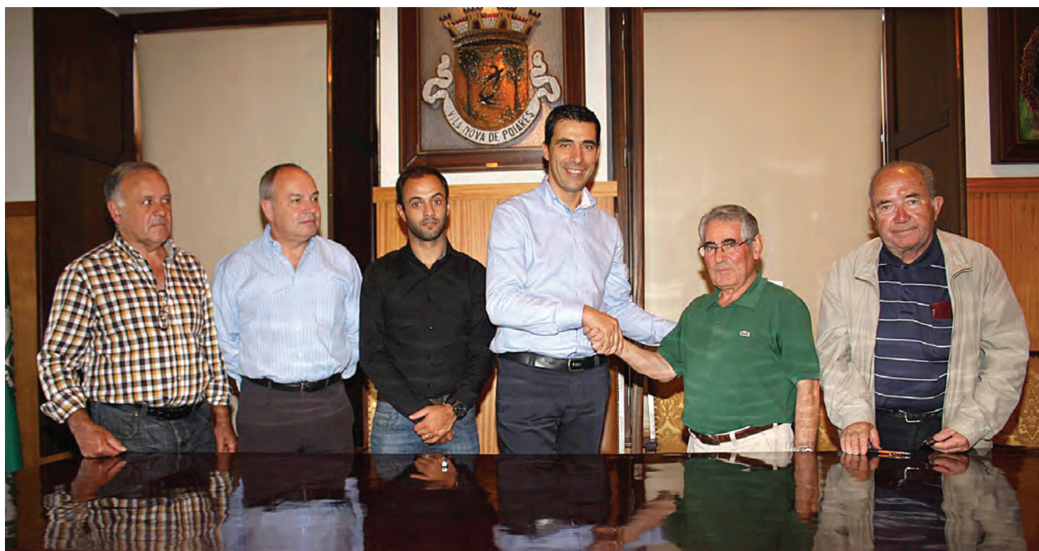
Assinatura do Protocolo com a Filarmónica Fraternidade Poiarense

No âmbito desta parceria, a Filarmónica Fraternidade Poiarense compromete-se a actuar em cerimónias, quando solicitada pelo Município, promover aulas de música e ainda a realização de um Encontro de Bandas Filarmónicas, que decorreu no âmbito do seu 140º aniversário, com a participação de três bandas filarmónicas, que além dos seus concertos individuais proporcionaram um concerto geral – Ensemble – orientado pela batuta do bem conhecido Maestro António Victorino D'Almeida.