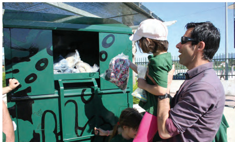
Presidente da Câmara também participou nas actividades dos mais pequenos