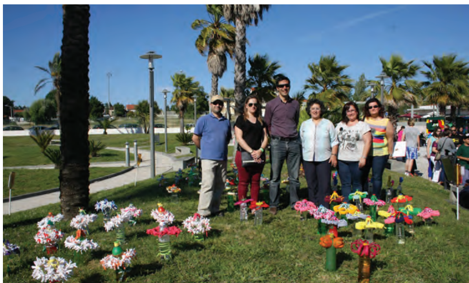
Exposição EcoFlores - Um trabalho da Associação iCreate