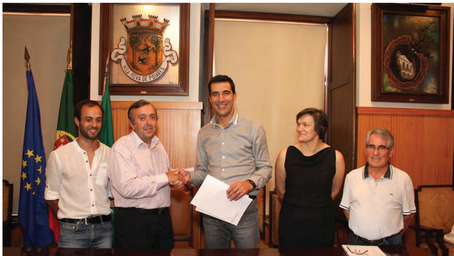
Assinatura do Protocolo com a APPACDM / Vila Nova de Poiares

Reconhecendo a relevante missão humanitária prosseguida pela Associação, bem como a importância e o alcance social da atividade que a mesma desenvolve no concelho de Vila Nova de Poiares, o Município compromete-se, através deste protocolo agora celebrado, e que vigorará até final do corrente ano, a apoiar a instituição no desenvolvimento de programas ocupacionais individuais e incentivos que permitam aos seus