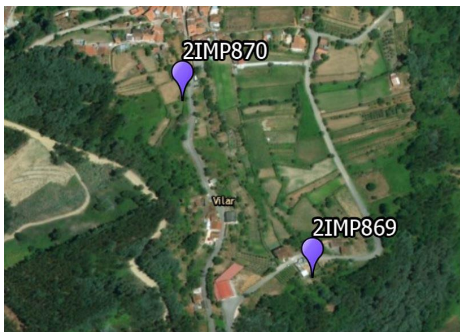
Local: Vilar, Vila Nova de Poiares