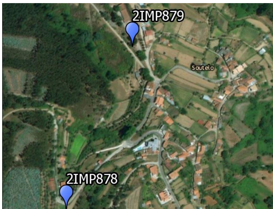
Local: Soutelo, Vila Nova de Poiares