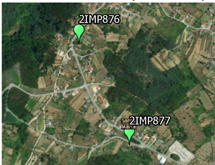
Local: Louredo, Vila Nova de Poiares