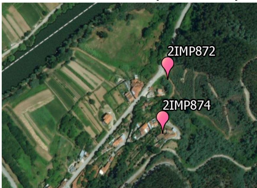
Local: Louredo, Vila Nova de Poiares